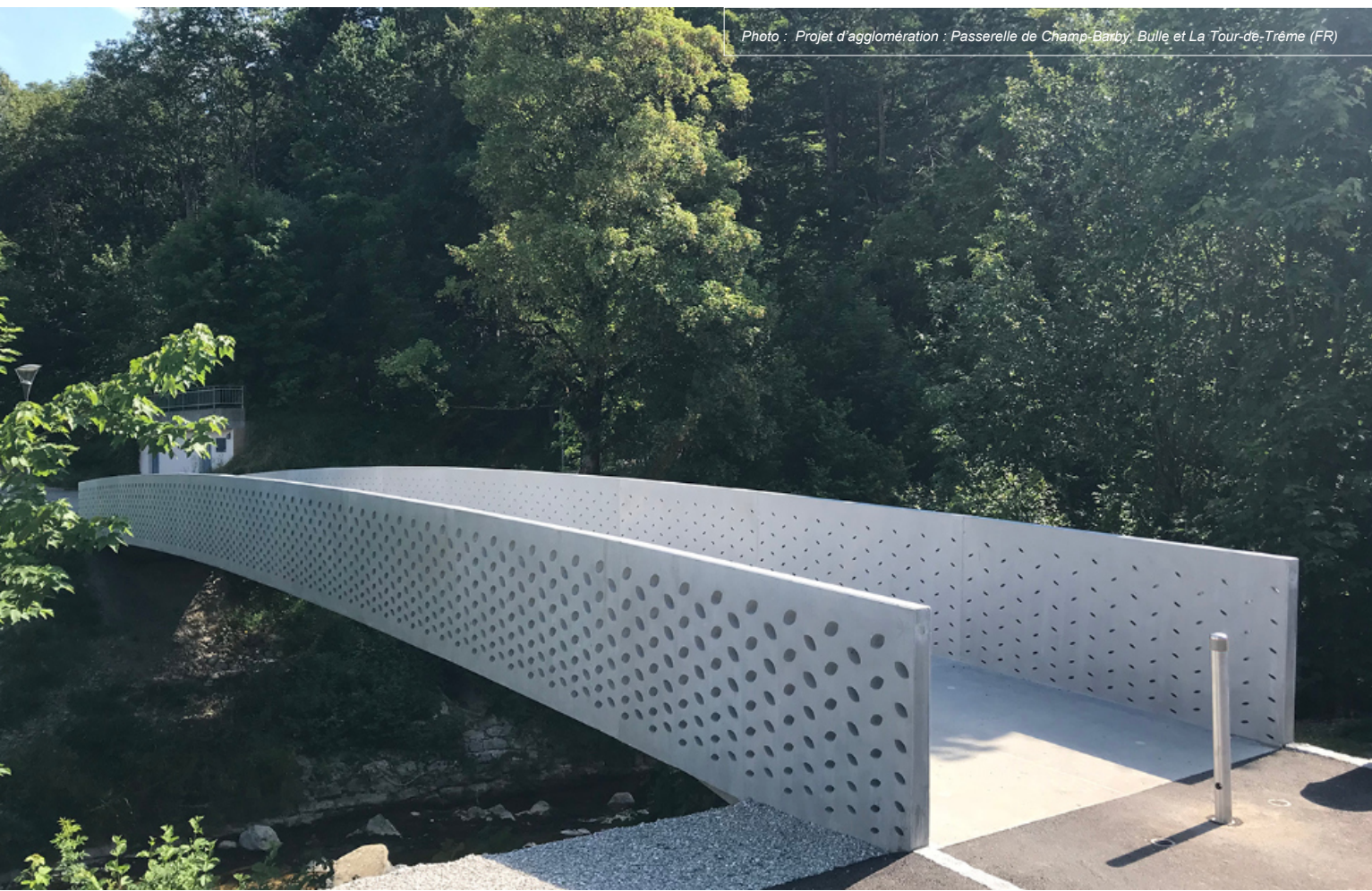
Photo : Projet d'agglomération : Passerelle de Champ-Barby, Bulle et La Tour-de-Trême (FR)